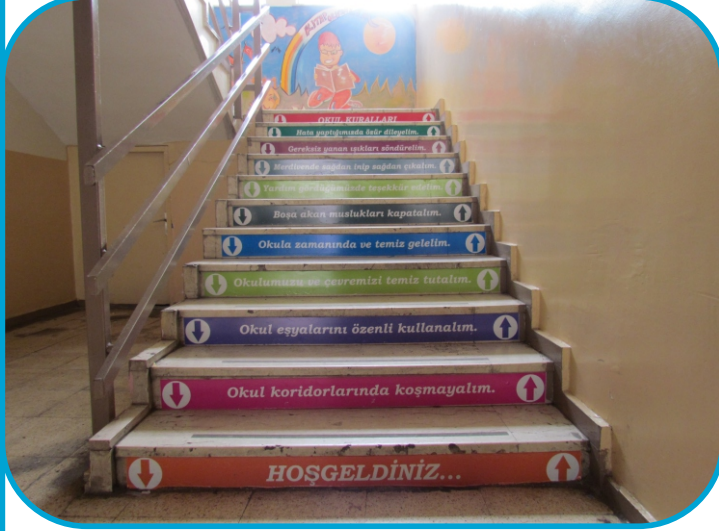
Zemin Kat-Okul Kuralları

Merdivenlere daha güzel görünüm kazandırmak ve öğrencilerimizin eğitimlerine katkıda bulunmak için, merdivenleri eğitici yazılarla süsledik.