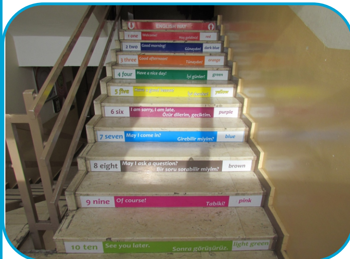
2. Kat-İngilizce Yolu