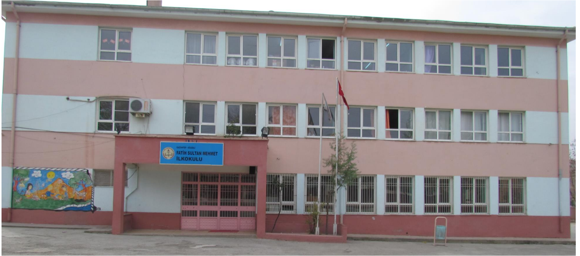
FATİH SULTAN MEHMET İLKOKULU